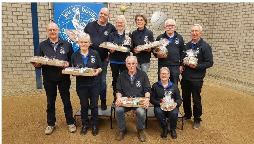
Clubkampioenschap tripletten 2020